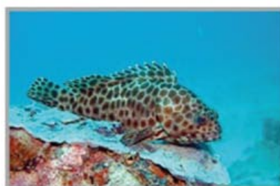
Pesce "nido d'ape" su NIDOPAN®