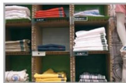
Scaffalature per negozio