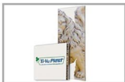
Pannello grafico stampabile