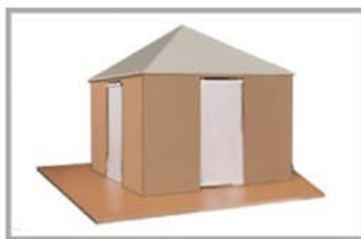
Casetta di Shigeru Ban